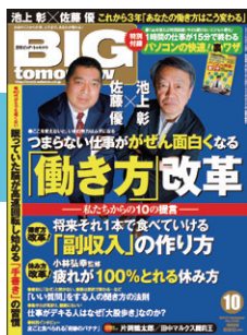
『BIG tomorrow』 昭和 55 年創刊 平成 29 年休刊

『BIG tomorrow』は、男性ビジネスパーソンを主な読者に、人の生き方や生活に役立つ情報を38年にわたりお送りしました。その妹誌として『SAY』、『美人計画 HARuMO』が誕生。多くの女性に、よりよく生きるための情報をお届けしてきました。