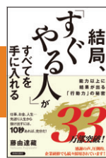
『結局、「すぐやる人」がすべてを手に入れる』 藤由達藏 (平成27年刊) 33万部