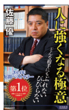
『人に強くなる極意』 佐藤 優 (平成25年刊) 35万部