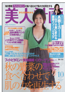
『美人計画 HARuMO』 平成 19 年創刊 平成 21 年休刊