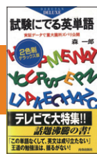
『試験にできる英単語』 森一郎 (昭和42年刊) 1500万部

昭和42年発刊「試験にできる英単語」(通称「でる単」)は現在までに1500万部を突破。「読者の心の糧となり、生きる勇気が湧くように」との思いで出版活動を続け、『日本人のしきたり』『人に強くなる極意』など数々のベストセラーを生み出しています。