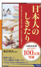
『日本人のしきたり』 飯倉晴武／編 (平成15年刊) 100万部