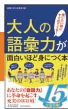
『大人の語彙力が面白いほど身につく本』 話題の達人倶楽部／編 (平成29年刊) 15万部