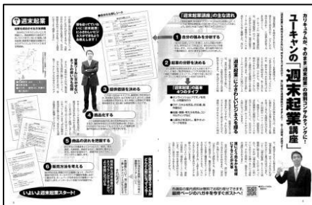
BIG tomorrow 07年3月号 BOOK in BOOKとして制作 協賛 / ユーキャン