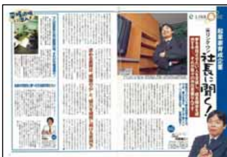
BIG tomorrow 06年3月号～7月号 にてタイアップ掲載後、タイアップ部分 に表紙をつけ小冊子を制作 協賛 / リンク・ワン